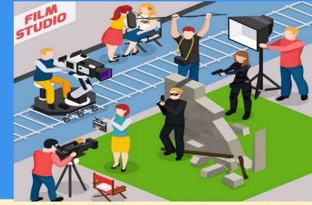
IMAGEN Y SONIDO

La comunicación audiovisual es algo omnipresente en nuestras vidas. El objetivo principal de esta asignatura es entender y producir lenguaje audiovisual de calidad, tanto desde el punto de vista técnico como creativo: analizaremos y reflexionaremos sobre series, cine, publicidad, videoclips y producción musical, y produciremos contenidos audiovisuales. Por el camino aprenderemos sobre lenguaje cinematográfico, fotografía, preproducción y producción audiovisual, guión, rodaje, sonido, historia del cine y de la música... todo en un ambiente distendido y de desarrollo de la creatividad.